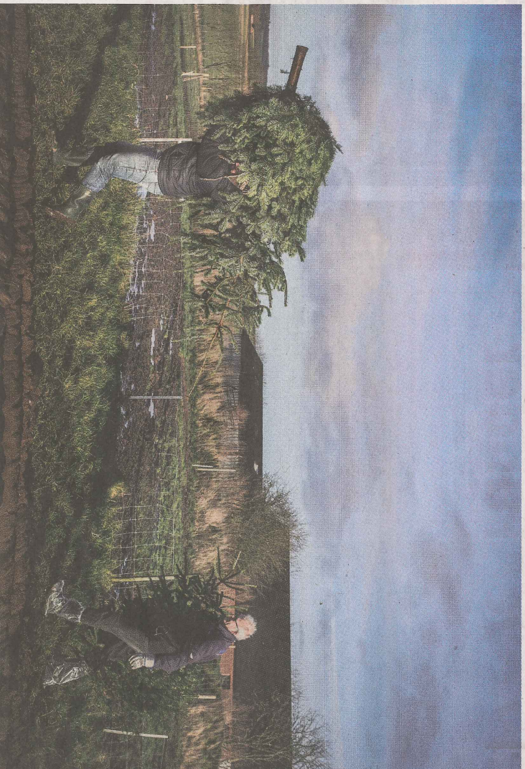
○ Mange besøgende havde proppet det gamle juletræ i bilen for at kunne aflevere det til grisene ved Mollerup.

Det er ikke kun grisene, der er økologiske. 30 ud af 250 hektar er omlagt til økologi, og det er planen, at yderligere 22 hektar bliver økologisk til sommer.