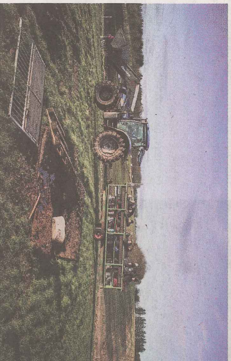
○ Med traktor og ladvogn blev de besøgende sammen med deres juletræer fragtet ned til marken med grisene.